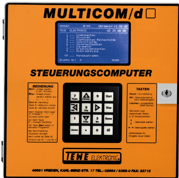
Ausführung Multicom TF / d