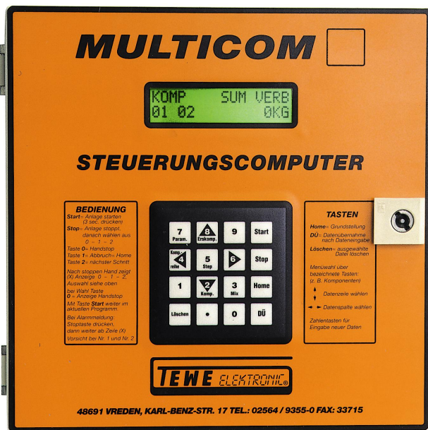
Ausführung Multicom TF

Der Multicom TZ ist ein leistungsfähiger 16-bit Trockenfütterungscomputer zur Steuerung von Trockenfütterungsanlagen mit 2 Ketten, 9 Komponenten und 50 Futterventilen (alternativ 3 Komponenten und 100 Futterventile). Über ein PC-Programm kann der Multicom T vollständig ferngesteuert werden. Mit Hilfe von Modems ist diese Fernsteuerung sogar über Telefonleitung weltweit möglich. Der Datenaustausch mit anderen Auswertprogrammen ist über Austausch von ASCII Dateien einfach möglich. Durch Einstellung bestimmter Softwareschalter kann die Funktion des Programmes aktiviert werden. Dabei werden bestimmten Datenspalten im Programm eine abgeänderte Funktion zugeordnet. Das Programm Multicom TZ ist eine Programmerweiterung des Programmes Multicom TF. Das Wiegesystem wird deaktiviert. Die Dosierung der Futtermengen erfolgt zeitgesteuert über die Angabe der Dosiermenge pro Zeiteinheit in den Komponentendaten. Die Funktionen im Programm Multicom TZ stimmen weitestgehend mit den Funktionen des Multicom TF überein, siehe entsprechende Leistungsbeschreibung bzw. Handbuch. Aufgrund der im Vergleich zum Wiegesystem relativ ungenauen Dosierung ist die Verbrauchserfassung deaktiviert. Durch einen neuen Befehl Sensorfütterung kann abgefragt werden, welche Tröge leer sind und nur die leeren Tröge werden dann gefüttert.